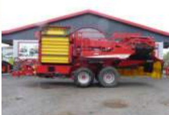
Grimme EVO 290 EasySep Bj. 20, 97ha, AMF + DMF autom., Speedtronic-Web, Steinbunker