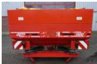
Rauch BETA-M Bj. 96, Streuscheiben 12-18m blau, Grenzstreuschreibe re., Plane 62025 2.000,00 €