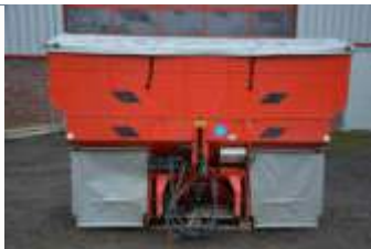
Rauch AXERA H EMC LS Bj. 09, Aufsatz GLB 1400 + GL 700, Plane, Streuscheiben D4H (12-42m) 70258 6.200,00 €