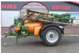
Amzone UX 5200 Bj. 06, 29.524ha, 33m, 9 TB, Profi- Klappung, Arbeitsscheinwerfer 98536 19.900,00 €