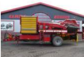
Grimme SE 260 UB Bj. 17, 485ha, Steinsicherung, DMF, 2 zusätzl. Abstreifer, Steinbunker 39673 56.800,00 €