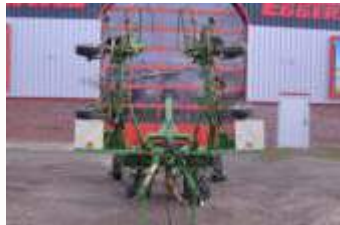
Stoll Speed 900H Bj. 95, 9m Arbeitsbreite, 8 Kreisel 60481 3.500,00 €