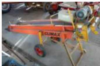
Climax CO33 ausfahrbares Aufnahmeband (3,30m- 6m), Breite 38cm