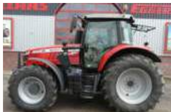
Massey-Ferguson 7718S Dyna-VT Bj. 18, 3.240 Std, 190PS, FKH 4t inkl. 2x Kuppler, autom. Seitenstabilisat. 42089 95.000,00 €