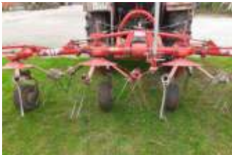
SIP Spider 400 Bj. 12, 4m Arbeitsbreite, 4 Kreisel 63128 2.500,00 €