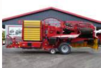
Grimme EVO 280 ClodSep Bj. 20, 245ha, autom. Dammmentlast., Bunkerbefüllautom., AMF + DMF