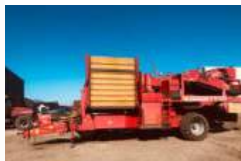
Grimme SE 150-60 NB Bj. 05, 800ha, 7,5t Bunker, AMF + DMF autom., Neigungsausgleich