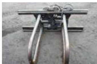
Baas Unibale Bj. 99, Ballenzange 62180 650,00 €