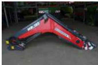
Manip MPower 180 Bj. 19, Hubkraft 2.500kg, HH 4,50m, Euro-Schnellwechsel, 3. Steuerkreis 57955 4.500,00 €