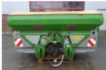
Amzone ZA-M 3000 Ultra hydro Bj. 09, ohne Wurfscheiben, Schwenk- plane XL, Beleuchtung, Amatron 13953 4.800,00 €