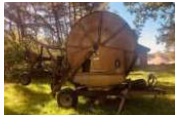
Nettuno 100x380m Bj. 02, Komet Twin 140, Wasseruhr, Ackerschienenanhangung 64072 6.200,00 €