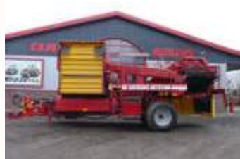
Grimme SE 260 UB Bj. 16, 420ha, autom. Dammmentlast., Einwurfrutsche re+li, Rodetiefenverst.