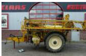
Dubex Vector 3200 Bj. 04, 27m, 3.000l, 9 TB, Hang- steuerung, hydr. klappbar 55786 5.800,00 €