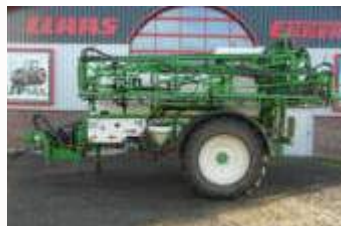
CHD D5530 Bj. 06, 8.364ha, 30m, 10 TB, 5.500l, hdr. Höhenverst., Hangsteuerung 58478 10.900,00 €