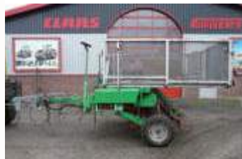
Plantex MUL Bj. 07, Plattform f. Kisten-Austausch, Schützbunker, Spuranreißer 58783 19.900,00 €