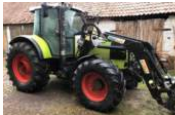
CLAAS ARES 696 RZ COMFORT Bj. 04, 10.150 Std., 145PS, 40km/h, mech. Kabinenfed., 4 Steuergeräte 95789 19.500,00 €