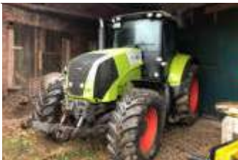
CLAAS AXION 820 CEBIS Bj. 07, 7.800 Std., 189PS, FKH 3,3t, HEXASHIFT Getriebe, 40km/h 99808 35.000,00 €