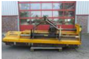
Müthing MU-M 280 Bj. 09, hydr. Seitenverschiebung, autom. Keilriemenspannung, Gelenkw. 70246 4.200,00 €