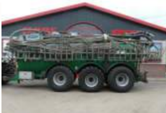
Samson PG 25 Bj. 13, 25.000l, 33m Schleppschlauch, Flowmesser, Sektionsentleerung