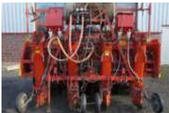
Grimme VL 30 KLSA Bj. 99 57433 8.127,85 €