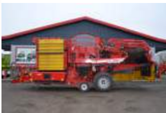
Grimme EVO 280 ClodSep Bj. 19, 380ha, mech. Rodetiefenverst., TerraControl, DMF, 4 Sechsscheiben