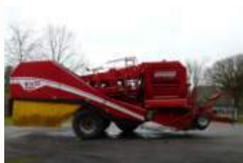
Grimme EVO 290 ClodSep Bj. 18, 610ha, 9t Bunker, Neigungs- automatik, Vorsatzelevator