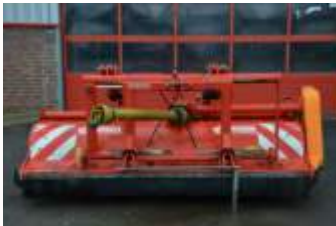
Dücker UM 27 HV G7 Bj. 12, 2,60m AB, Heckanbau, Seiten-verschiebung, Schlagschiene 26834 4.000,00 €