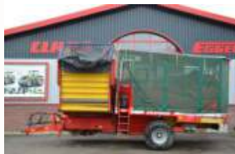
Grimme SE 85-55 SB Bj. 06, AMF + DMF autom., Zwiebelaufnahme, Verlesetisch breit 97811 38.000,00 €