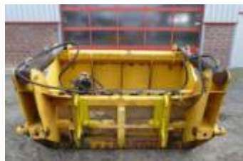
Bressel Schneidzange 623 Bj. 07, CLAAS Scorpion Aufnahme, 16 Zinken, 199x130x95cm, 2.460l 34096 1.500,00 €