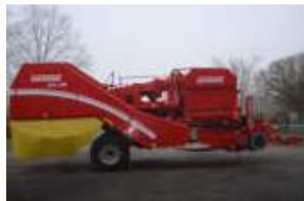
Grimme SE 260 UB Bj. 19, 400ha, 4 Sechsscheiben, 6t Bunker, Verlesetisch breit 62319 99.500,00 €