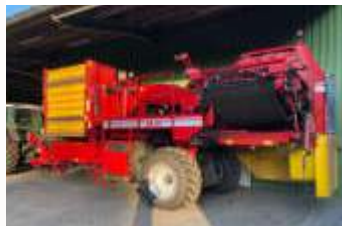
Grimme SE 260 UB Bj. 20, 180ha, TerraControl, Verlesetisch breit, Walzenvorreinigung 61459 126.000,00 €