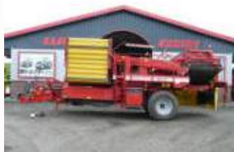
Grimme SE 260 UB Bj. 20, 204ha, Rodetiefenverstellung, Spiralwalzen-Abstreifer, Neigungsaut. 62372 112.000,00 €