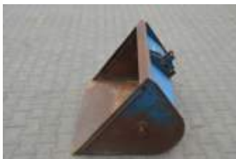
Frost Schaufel 1m Klinke 64342 100,00 €