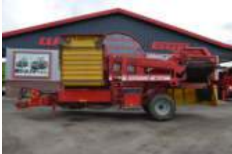
Grimme SE 260 UB Bj. 14, 890ha, DMF autom., 6t Bunker, Verleseband mit Mitnehmern 34315 64.000,00 €