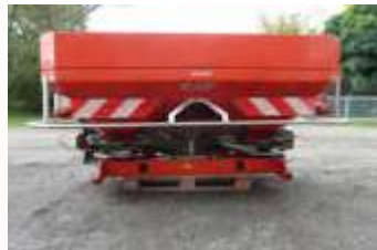
Rauch Axis 50.1 HT EMC Bj. 14, Wurfscheiben S6 VxR, ohne Terminal, Schmutzfänger 44862 8.500,00 €