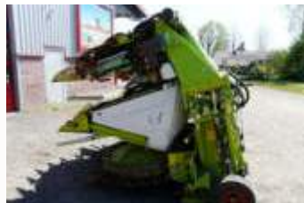
CLAAS ORBIS 750 3T Bj. 15, Auto Contour, Auto Pilot Lenk- automat digital