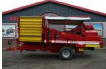
Grimme SE 75-55 SB Bj. 21, 5,5t Bunker, Einwurfrutsche re+li, Walzenvorreinigung, Neigungsaut. 57749 108.823,53 €