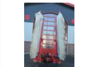
Lely Splendimo 900 M Bj. 16, 9m AB, Beleuchtung, Lager-schaden am rechten Mähwerk 64219 11.900,00 €