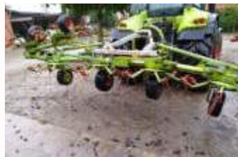
CLAAS VOLTO 870 8,70m Arbeitsbreite, 8 Kreisel, Breitverteiler, Gelenkwelle 63520 6.500,00 €