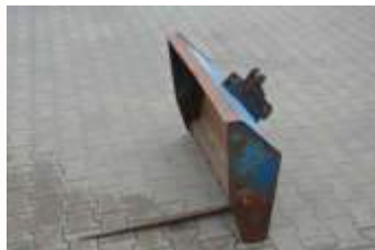
Frost Dunggabel 1m Klinke, 1 Zinken vorhanden