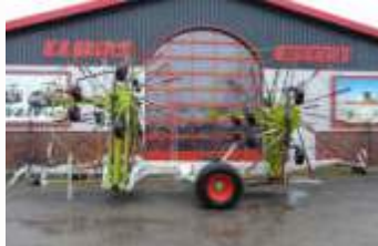
CLAAS LINER 3600 COMFORT Bj. 15, 7.250ha, 12,50m AB, 4 Kreisel, Kreisel-Höhenverst., Communicator II 33616 33.000,00 €