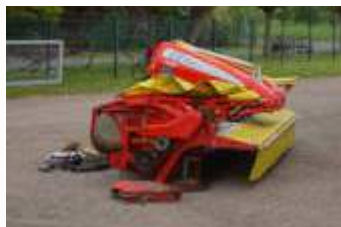
Pöttinger NOVACAT 301 alpha-motion ED (Front) + A10 ED (Heck) Mähwerkskombination, Bj. 18, Aufbereiter, Schnitthöhenverstellung, Gelenkwelle, AB Front 3m, AB Heck 8,80-10m 62175 39.000,00 €