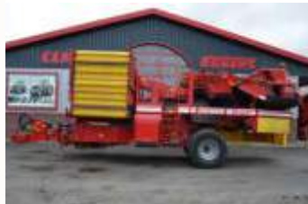
Grimme SE 150-60 SB Bj. 19, 470ha, Steinbunker, Damm- mentlastung + DMF autom., 7,5t Bunker