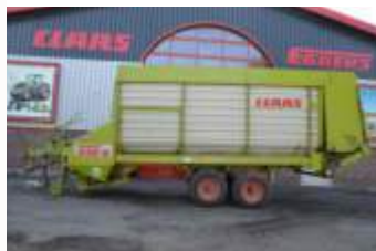
CLAAS SPRINT 330 S Bj. 86, Dosierwalze, 40km/h, 33m 3 , Füllstandsanzeige, Pick Up 1,60m 64149 9.000,00 €