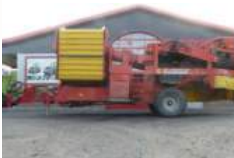
Grimme SE 150-60 SBR Bj. 03, 990ha, Befüllautomatik, DMF, autom. Neigungsausgleich