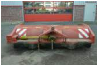
Gruse KS 300 auch als Mulcher einsetzbar, Schlegelsatz zum Umbau vorhanden 63460 2.500,00 €