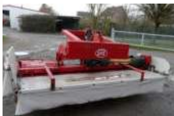
Lely Splendimo 320 FC (Front) + Splendimo 900 MC (Heck) Schmetterlingskombination, 8,90m Arbeitsbreite, Aufbereiter, Breitverteiler, Gelenkwelle, Beleuchtung 55827 10.900,00 €