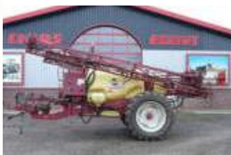
Hardi Commander 4200 Bj. 07, 15.734ha, 27m, 4.200l, Hang- steuerung, Section Control 60738 12.000,00 €