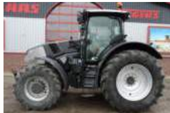
CLAAS AXION 830 CAMTIC LU Bj. 15, 6.815 Std., 240PS, CEBIS, 50km/h, gef. VA Proactiv, Radarsens. 34617 62.000,00 €